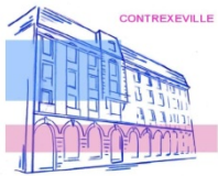
Lycée des Métiers Pierre Mendès-France Le Goût et le Bien-être